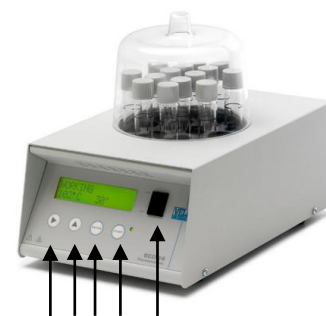
A B C D E

L'interrupteur principal (E) allume l'appareil.