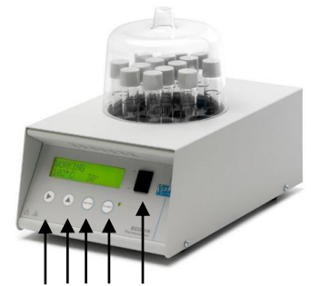
A B C D E

L'interruttore generale ( E ) accende e spegne lo strumento.