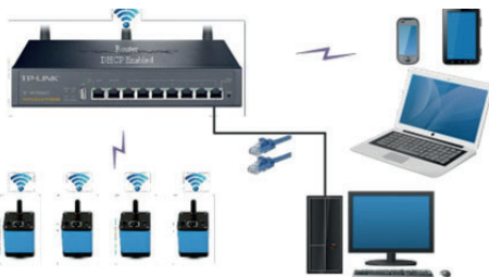
Figura 5 Conexión de varias cámaras al router a través del modo WiFi STA

En el modo WiFi STA, se supone que la cámara se conecta al router.