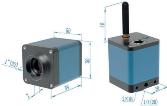
Figura 2 Dimensiones de la cámara USB/LAN/WiFi