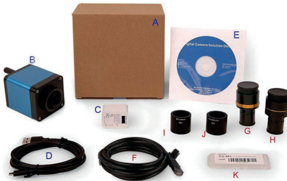
Figura 3 Información de embalaje de la cámara USB/LAN/WiFi