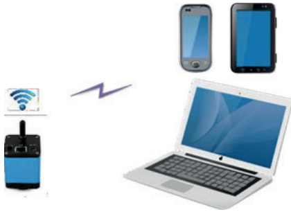
Figura 4 El PC o el dispositivo móvil se conectan a la cámara a través del modo WiFi AP

A continuación se indican los pasos para poner en marcha la cámara: