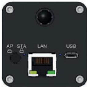
Figura 1 Puertos disponibles en el panel posterior del cuerpo de la cámara