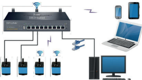
Figura 7 Conexión de varias cámaras al router a través del puerto LAN/modo WiFi STA

En el modo LAN/ WiFi STA, la cámara se conecta al router por cable Ethernet o con el modo WiFi STA