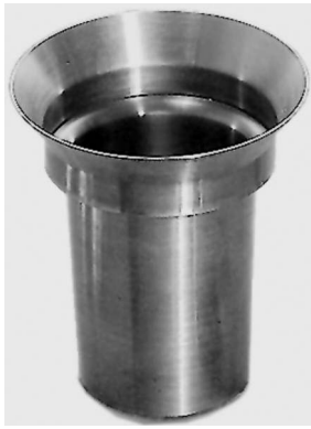
VASO TINTORERO En acero inox. AISI 304. Volumen: 500 ml. Código 6000291