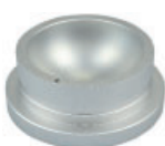
LBM009 Adaptateur pour ballon fond rond 500 mL.