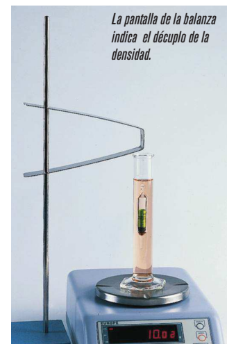
La pantalla de la balanza indica el decuplo de la densidad.