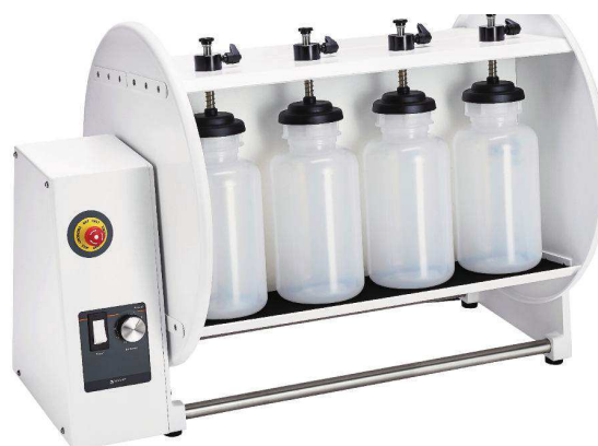
Modelo Reax 20-8.

Se suministran con adaptadores para frascos de 1,5 a 2 litros.