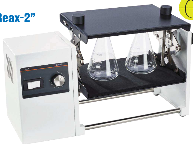
Agitador REAX-2 con adaptador Universal incluido.

5054921 Adaptador gradilla para 20 tubos de 10 a 18 mm Ø.