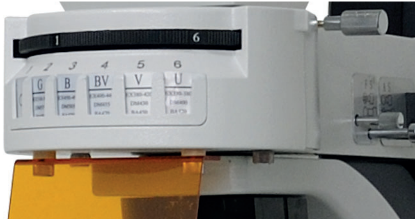
tableau de filtres