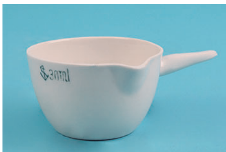
DIMENSIONS - Fond plat