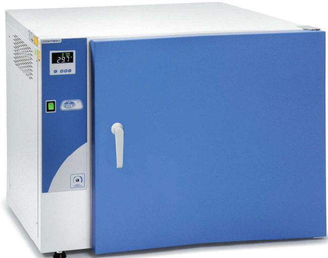
Modelo Conterm tipo Poupinel, códigos 2000252 y 2000254.