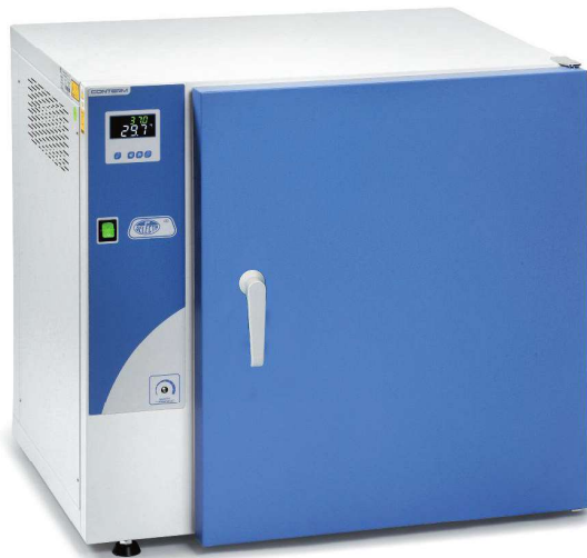
Modelos Conterm, códigos 2000250, 2000251 y 2000253.

CARACTERÍSTICAS, PANEL DE MANDOS, SEGURIDAD, NORMAS Y ACCESORIOS (ver págs. 196 y 197).