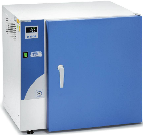
Modelos Conterm, códigos 2000250, 2000251 y 2000253.

CARACTERÍSTICAS, PANEL DE MANDOS, SEGURIDAD, NORMAS Y ACCESORIOS (ver págs. 196 y 197).