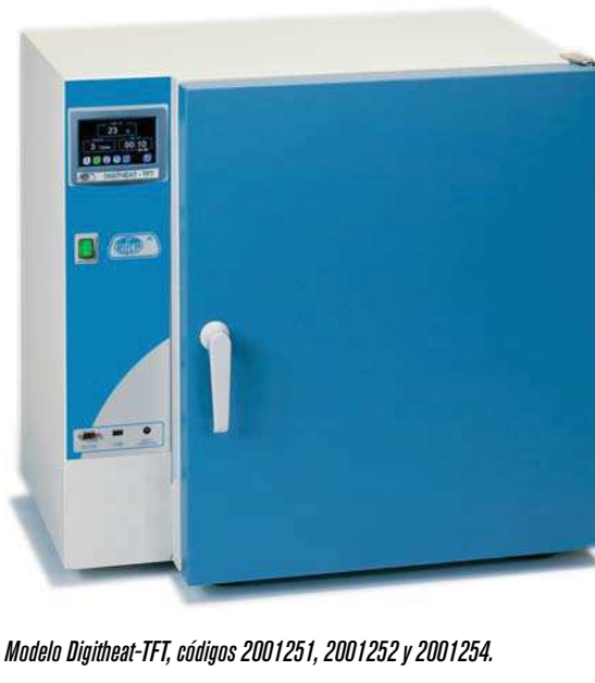
Modelo Digitheat-TFT, códigos 2001251, 2001252 y 2001254.