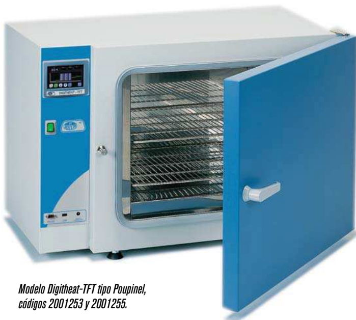
Modelo Digitheat-TFT tipo Poupinel, códigos 2001253 y 2001255.

CARACTERÍSTICAS, PANEL DE MANDOS, SEGURIDAD, NORMAS Y ACCESORIOS (ver págs. 192 y 193).