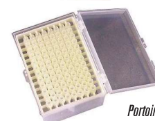
Portoir pour pointes

Support pour pipettes. En acier inox. AISI 304. Capacité: 6 pipettes de différentes tailles, jusqu'à 28 cm de longueur. Code 1001215