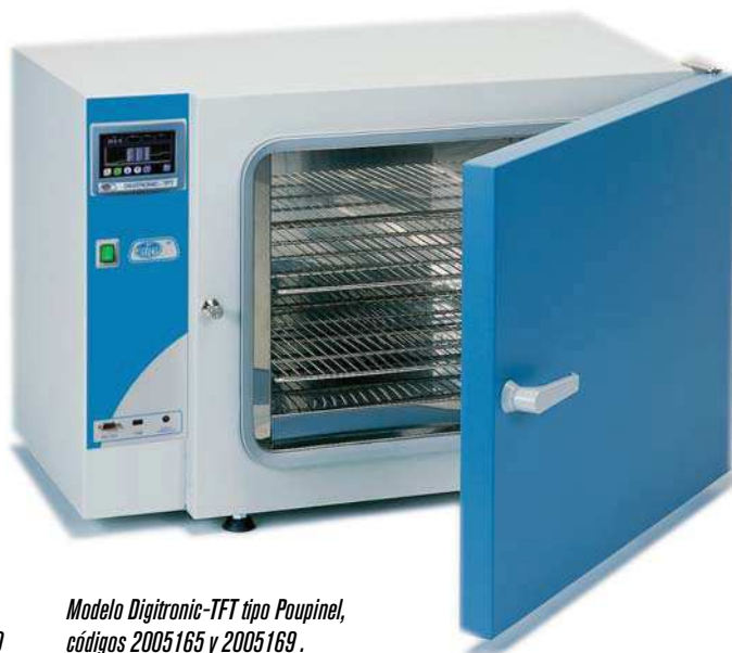
Modelo Digitronic-TFT tipo Poupinel, códigos 2005165 y 2005169.