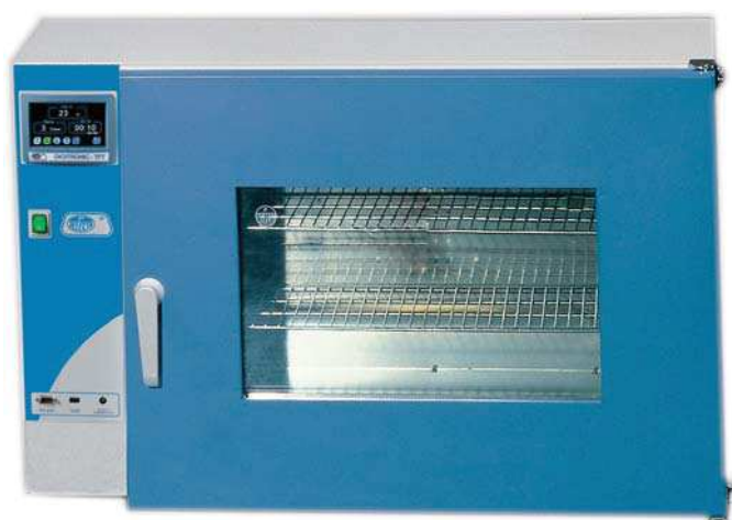
Modelo Digitronic-TFT tipo Poupinel con puerta de cristal doble códigos 2005166 y 2005170