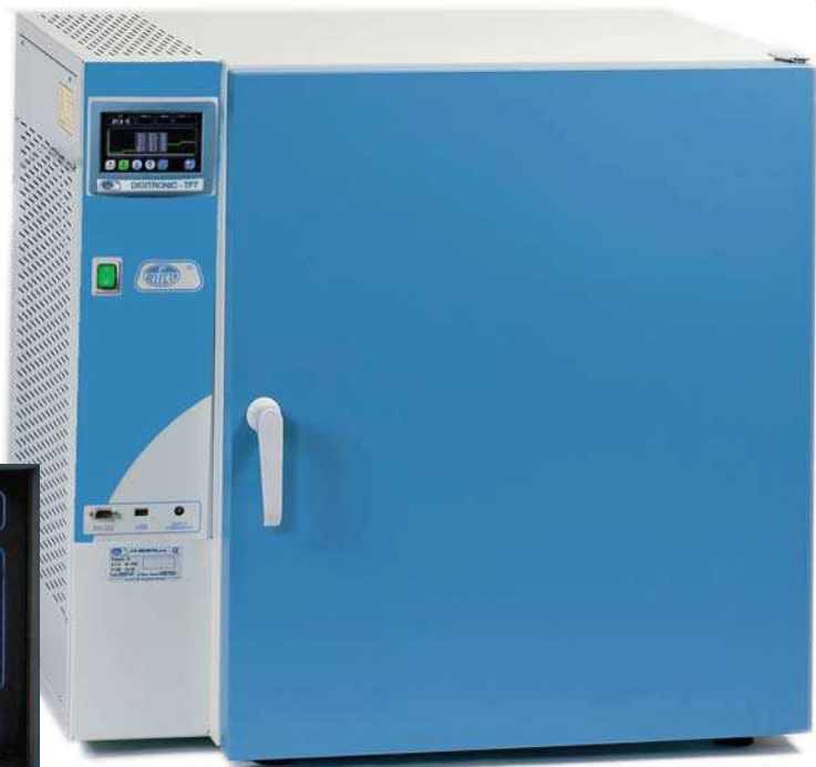
Modelo Digitronic-TFT con puerta metálica, códigos 2005163 y 2005167. (Con puerta de cristal códigos 2005164 y 2005168).