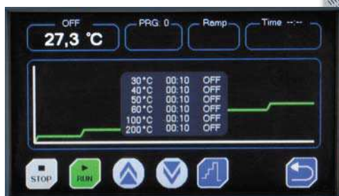
Pantalla con gráfico de rampas de temperatura