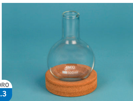
FIOLE fond rond, verre

d_1 : diamètre d_2 : diamètre h : hauteur