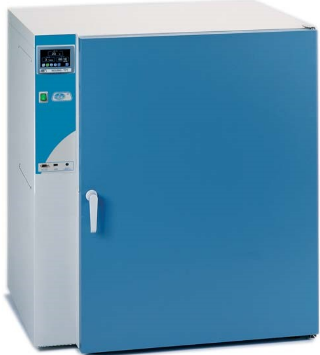
Modelo código 2000238.

Para códigos 2000239 y 2000240, 2 bandejas.