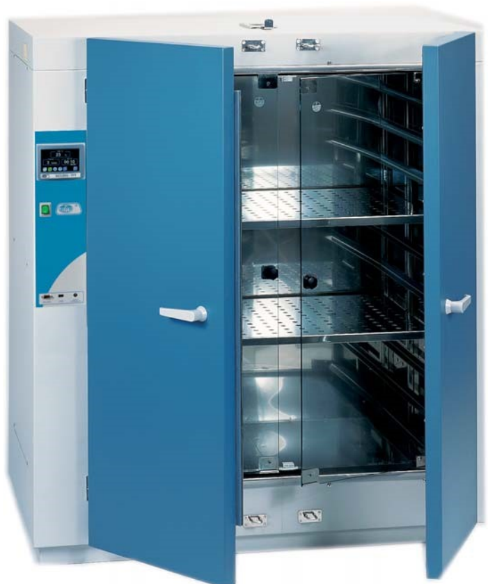
Modelos códigos 2000239 y 2000240.

Nota: La óptima homogeneización de la temperatura se consigue con una razonable distribución del espacio y carga, no sobrepasando el 70% del volumen útil.