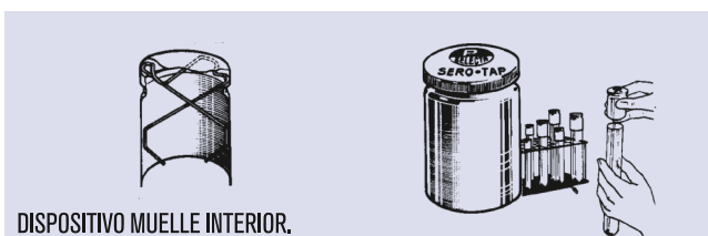
DISPOSITIVO MUELLE INTERIOR.