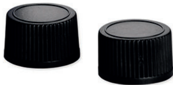
Ref. - CGL030