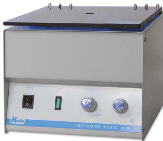
REF. GBC002; GBC003