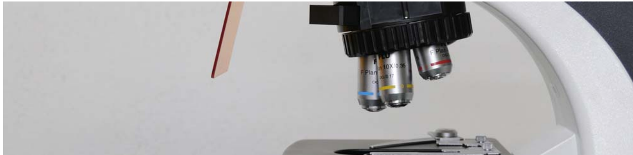
tabla características objetivos