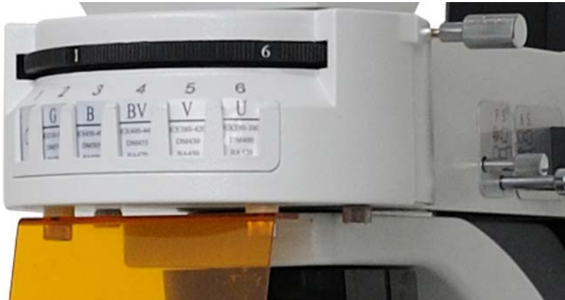
tabla de filtros